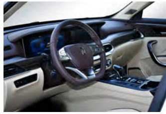
Beige con café