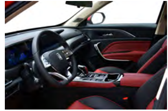
Rojo con negro