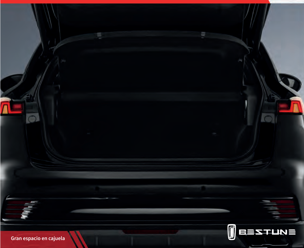
Gran espacio en cajuela