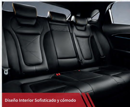
Diseño Interior Sofisticado y cómodo