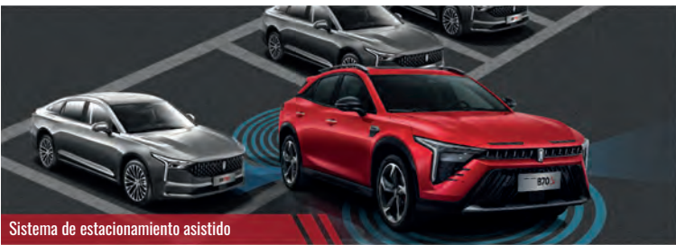
Sistema de estacionamiento asistido