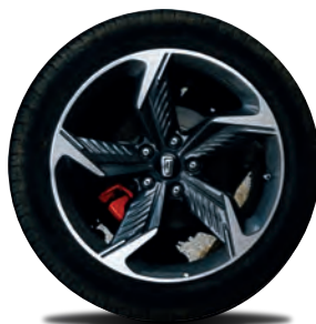
245/45 R19 Ares 2.0T