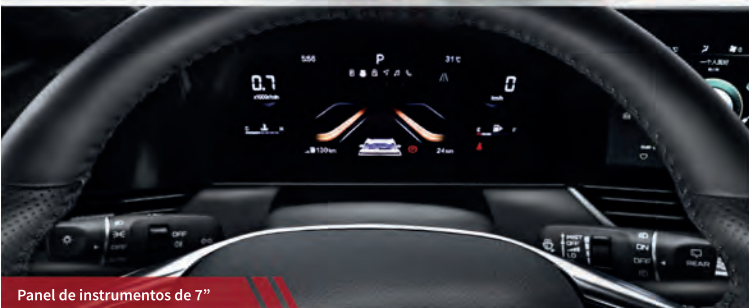
Panel de instrumentos de 7"