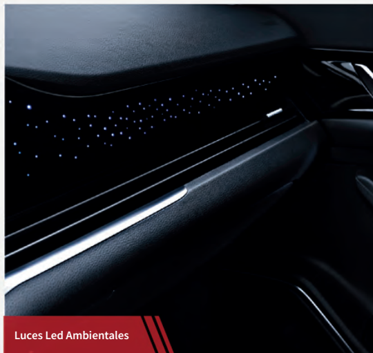
Luces Led Ambientales