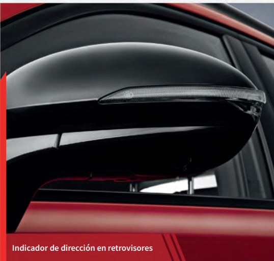
Indicador de dirección en retrovisores

NUEVO DISEÑO Lo mejor del B70 con nuevas mejoras