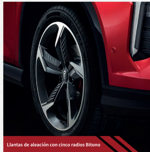
Llantas de aleación con cinco radios Bitono