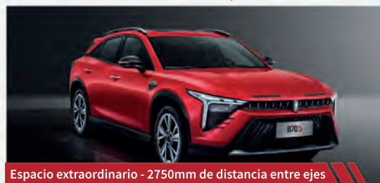
Espacio extraordinario - 2750mm de distancia entre ejes

Más comodidad sin limitaciones de espacio