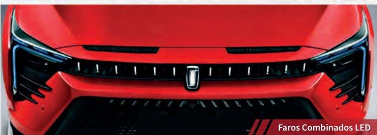
Faros Combinados LED