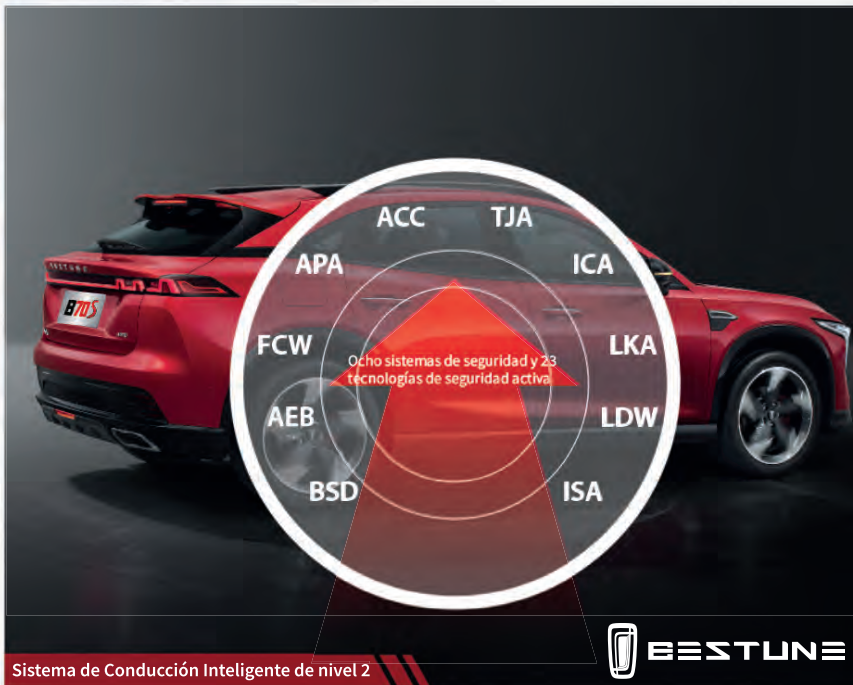
Sistema de Conducción Inteligente de nivel 2

SEGURIDAD Protección para un viaje sin preocupaciones